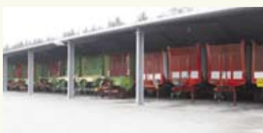
Der Fuhrpark wartet auf den Einsatz

Der Kreis Diepholz zeichnet sich sehr stark durch Veredlung aus. Die Landwirte fordern den Dienstleister mit einer schlagkräftigen Maschinenausstattung, damit Arbeitskapazitäten für die Stallarbeit frei bleiben.