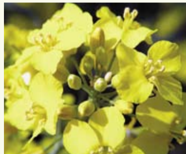
EURALIS verfügt über ein umfangreiches Sortiment an Hybrid- und Liniensorten

mittlere Blüte und Reife, hoher Korn-ertrag, sehr phomatolerant