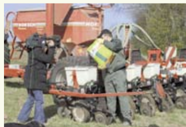
Der Film ist in Zusammenarbeit mit unseren Kunden und Partnern entstanden

Wir geben Ihnen Einblicke in die Entstehung und die Historie von EURALIS Saaten, führen Sie auf unseren Weg von Frankreich nach Deutschland und zeigen Ihnen, auf