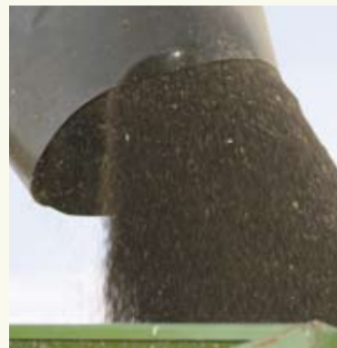
Heute werden durchschnittlich 3,5 t Rapssamen pro ha geerntet

gerade im Februar deutet darauf hin, dass dieses Szenario am Markt schon Wirkung zeigt.