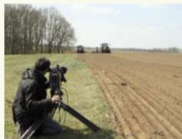
Dreharbeiten bei der Maisaussaat

Endlich ist es so weit – der EURALIS Film ist fertig. Eine spannende Geschichte über EURALIS Saaten und ihre Muttergesellschaft. Über ein Jahr haben die Dreharbeiten für den EURALIS-Film gedauert. Die Aufnahmen wurden in mehreren Orten Deutschlands gemacht. Das Projekt ist in Zusammenarbeit mit der TVN