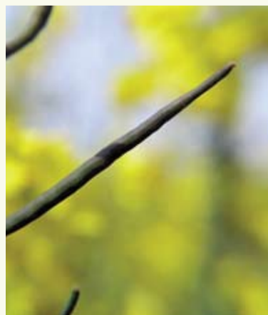
Die besten Hektarerträge erzielen die Landwirte in Deutschland und Frankreich

Drusch nicht geöffnet werden und die Körner mit zurück auf den Acker bringen. Durch die Feuchtigkeit, die aus den angeschlagenen Schoten kommt, kleben ausgedroschene Körner an den Pflanzenresten und gehen zurück auf den Acker.