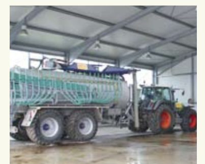
Der Betrieb verfügt über eine eigene Waschanlage