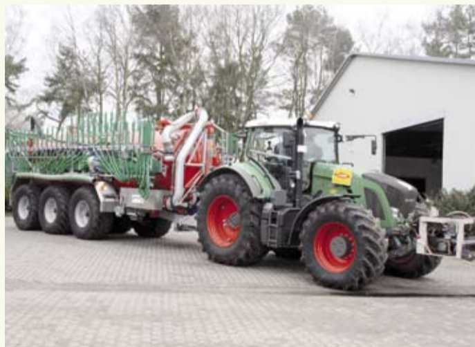
Die Maschinen sind mit der neuesten Technik ausgestattet

Stets im Dienste der Landwirtschaft Den Kunden des Lohnbetriebs Henke steht eine große Anzahl von landwirtschaftlichen Maschinen, Geräten