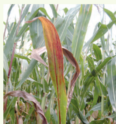
Hinweis auf Gelbverzwergungsvirus: Rotverfärbung der Blätter

bestellen, die es dieses Jahr in Standardbeizung mit 2,5 Mio. Körnern und mit Mesuroelbeizung mit 2,25 Mio. Körnern gibt. Alle Informationen über Preise und Beizvarianten zu allen Sorten finden Sie unter www.euralis.de/pf