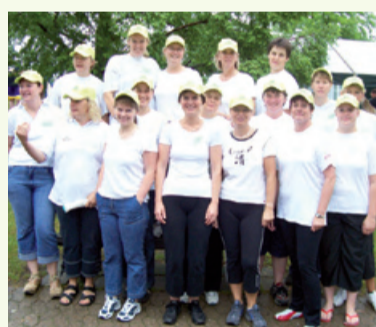
Strahlende Siegerinnen trotz strömendem Regen