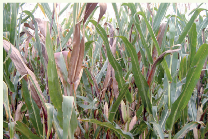
Mögliche Ertragseinbußen durch frühes Abtrocknen der Blätter

Zur Vorbeugung des Gelbverzwergungsvirus ist eine Bekämpfung der Blattläuse im Mais mit Poncho bzw. Poncho Pro vom 2 bis 10-Blatt Stadium (Frühbefall) möglich. olibe/sam