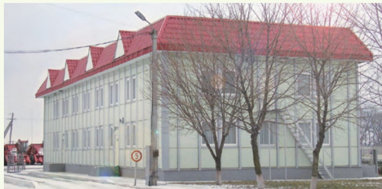
Ein großzügiges neues Bürogebäude gehört zum Fabrikgelände

EURALIS vertreibt in Zentraleuropa Wie bereits im Keimblatt Nr. 7 berichtet ist EURALIS Saaten seit Mai 2007 auch für den Markt in Zentraleuropa zuständig. Grund für diese Umstrukturierung ist die Expansion von EURALIS Semences in der Ukraine. Dort sollen die bereits seit Jahren bestehenden Aktivitäten von EURALIS in der Ukraine und in Russland mit einem eigenen Verkaufsteam und einer eigenen Saatgutaufbereitungsanlage unterstützt und gestärkt werden. Die Vermarktung der Produkte erfolgt unter der Marke CHERLIS mit einem eigenen Verkaufsteam. Das Saatgut, das bisher in Frankreich produziert und in die Ukraine transportiert wurde, wird jetzt in der Region um Cherkasy vermehrt und über eine eigene Aufbereitungsanlage für den Verkauf vorbereitet.