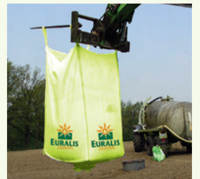
Einfache Handhabung mit Front- oder Teleskoplader

Schiebern sowie weitere Vorschläge werden derzeit noch geprüft.