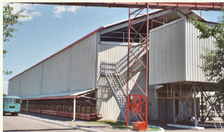
Die gesamte Anlage ist sehr gepflegt und funktionstüchtig

Bereits zur Aussaat 2007 wurde die Vermehrung unter der Regie von EURALIS Semences angelegt. Dabei haben die Mitarbeiter gleich im ersten Jahr die schwierige Seite dieser Region kennengelernt. Mit Tagestemperaturen von weit über 40° Celsius während der Blüte wurde der Pollen regelrecht verbrannt, so dass die Ernterwartungen deutlich nach unten korrigiert werden mussten. Aber da EURALIS dieses Projekt als langfristige Investition in diese Märkte ansieht, werden die Mitarbeiter vor Ort auch sicher bald die positiven Seiten dieser Produktionsregion kennen lernen. pf