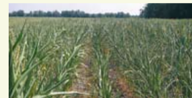
Blätterrollen entlang der Längsachse: ein typisches Bild in einem Schlag mit Trockenstress

Mais kann als C4-Pflanze also mit weniger Wasser auskommen als andere Pflanzen, ohne das Wachstum einstellen zu müssen.