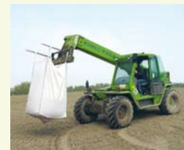
Beim Transport der BigBags leisten Teleskop- oder auch Fronlader gute Arbeit

Mehr Informationen erhalten Sie in den nächsten Wochen unter www.euralis.de oder bei einem Besuch auf der EuroTier in Hannover. Dort finden Sie uns auf dem Gemeinschaftsstand des Fachverband Biogas in Halle 27 Stand D29. Für nähere Informationen zu den Erfahrungen aus 2006 kontaktieren Sie auch gerne unsere Außendienstmitarbeiter. pf