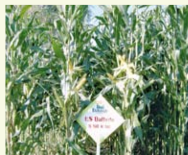
ES Ballade: sichtbar frühreif ohne Stängelfäule

Ende Mai/Anfang Juni werden jedes Jahr noch mehr als 80.000 ha Mais in Deutschland gesät. Meist nach Gras oder Grünroggen oder auch in Höhenlagen. ES Ballade ist die ideale Sorte für solche Spätsaaten. Kommt Mais erst im späten Frühjahr als Zweitfrucht auf den Acker, ist eine frühe Blüte unverzichtbar und die hat ES Ballade! Je weiter die Blüte nämlich in den Hochsommer rutscht, desto größer wird das Risiko, dass die Befruchtung unter der Hochsommertrockenheit leidet. Denn die Blüte ist das Stadium mit dem höchsten Wasserbedarf.