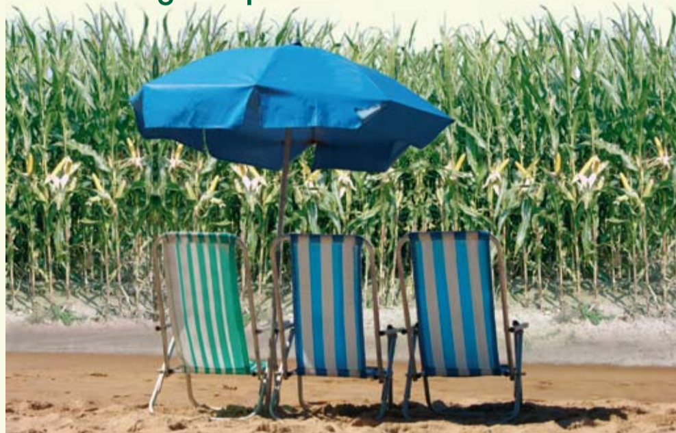
Freud und Leid lagen in diesem Jahr eng beieinander, wenn es um die Sonnenscheindauer ging

Insbesondere in großen Teilen des norddeutschen Binnenlandes und in Ostdeutschland war es teilweise um mehr als sechs Grad wärmer, im Vergleich zum Referenzwert der internationalen klimatologischen Bezugsperiode von 1961 bis 1990. Gleichzeitig hatten wir im gleichen Gebiet sehr große Sonnenschein-Überschüsse, die vereinzelt mehr als 175% über dem langjährigen Bezugsniveau lagen.