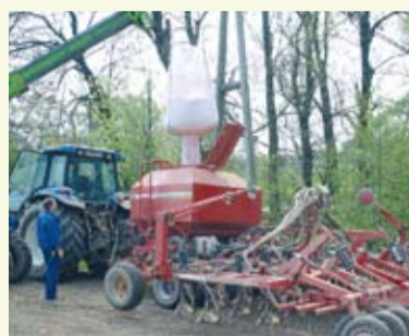
Die Befüllung der Drillmaschine funktioniert reibungslos

konnten dabei auch gleich Drillmaschinen verschiedener Hersteller getestet werden, die alle problemlos arbeiteten.