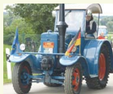
Der Oldtimer-Umzug ließ nicht nur Männerherzen höher schlagen

Am Dienstag den 15. August lockte der „Tag des offenen Hofes“ wieder tausende Besucher in das Vilstal nach Rottersdorf bei Dingolfing. Jedes Jahr findet das Fest für die ganze Familie an Maria-Himmelfahrt statt. Für Jung und Alt gab es nicht nur viel zu sehen, sondern auch aktiv zu erleben. Die Kleinen hatten z.B. viel Spaß beim Kartoffel-Wettklouben und Melken. Neben